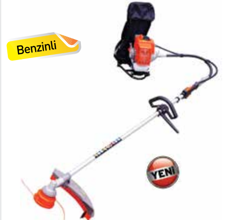
BG430A / BG520A