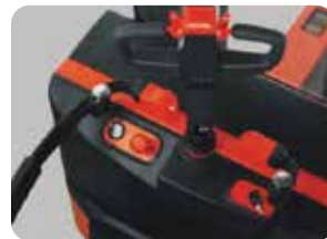
Akü şarj göstergesi, acil stop butonu