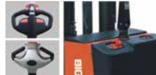
Kumanda kolu Akü sarj göstergesi ve acil stop butonu.