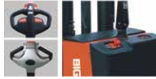
Kumanda kolu Akü şarj göstergesi ve acil stop butonu.