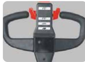
CURTIS kumanda kolu