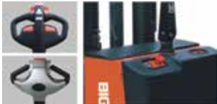
Kumanda kolu Akü sarj göstergesi ve acil stop butonu.