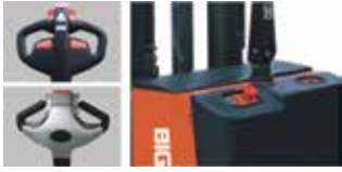
Kumanda kolu Akü şarj göstergesi ve acil stop butonu.