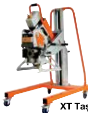
XT Taşıma ve Çalışma Arabası